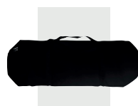
Bolso de transporte para alfombra dieléctrica