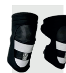
Kit para motociclista