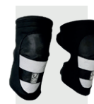
Kit para motociclista